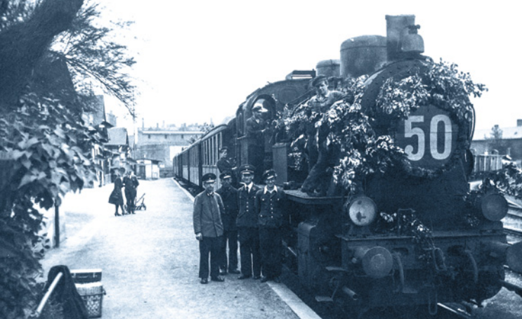
Im MAi 1946 feierte die Halle-Hettstedter Eisenbahn 50. Geburtstag.