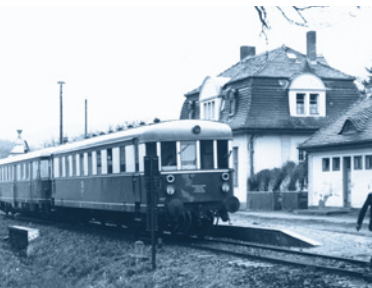
Zug der Wipperliese im Bahnhof Friesdorf im November 1974.

Unter dem Thema Eisenbahnchronik Mansfelder Land beschäftigt sich Teil 2 der Ausstellung im Mansfeld-Museum Hettstedt neben der HHE auch mit der Mansfelder Bergwerksbahn, der Elektrischen Kleinbahn Mansfeld und der „Wipperliese“ von Klostermansfeld nach Wippra.