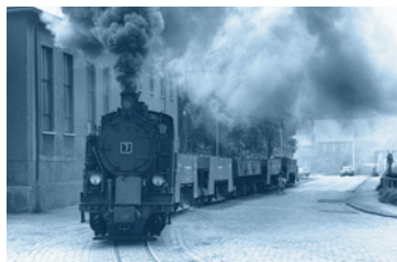
Die Bergwerksbahn bediente über 110 Jahre die Hüttenindustrie. Seit 1991 betreibt der „Mansfelder Bergwerksbahnen e. V.“ auf ca. 12 km einen Museumsbetrieb.

Mit einem historischen Bus des Straßenbahnfreunde e.V. befahren wir die Strecke der ehemaligen HHE von Halle nach Hettstedt und retour.