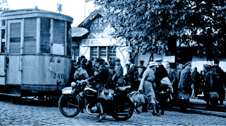
Straßenszene Ende der 1940er Jahre vor dem Bahnhof Kloster in Halle